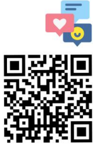
FACE BOOK การเงินนักศึกษา