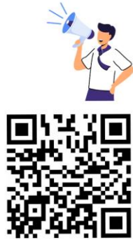
ข่าวประชาสัมพันธ์