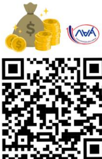
วงเงินกู้ยืม กยศ. โดยประมาณ