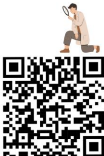
ตรวจผลส่งเอกสาร กยศ.