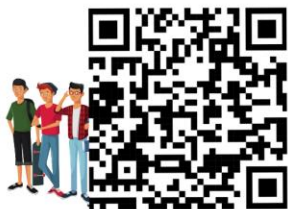
กู้ยืม กยศ. เกินหลักสูตร